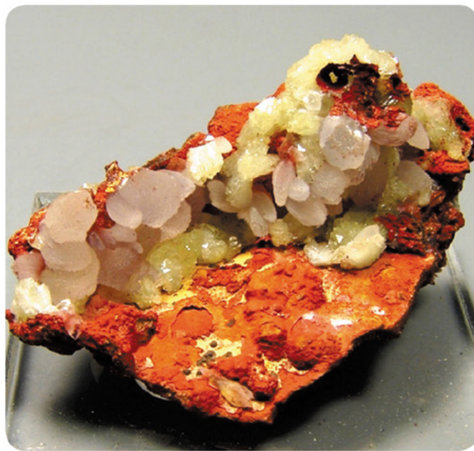
Адамин, кальцит (Ojuela Mine, Mexico)

— Сейчас не чаще двух раз в год. Во-первых, существующий запас позволяет нам активно работать на рынке. Экспедиции сегодня — это целое производство, зачастую не всегда рентабельное. В России практически не осталось мест, где