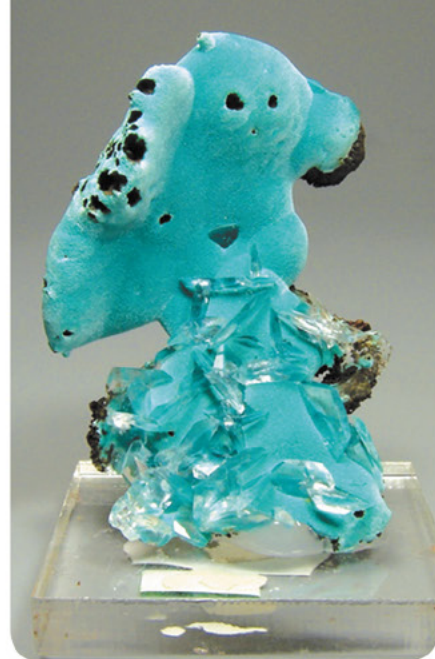
Позазимит, гунц (Ojuela Mine, Mexico)

бы не прошли руки человека, но сейчас разработки уже не ведутся на государственном уровне, как в советские времена. Во-вторых, открылись границы, что позволяет нам выкупать прекрасные экземпляры минералов со всего света. Российские коллекции сейчас дополняются камнями с месторождений Северной и Южной