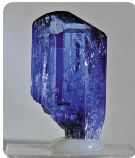
Танзанит (Merelani hills, Tanzania)