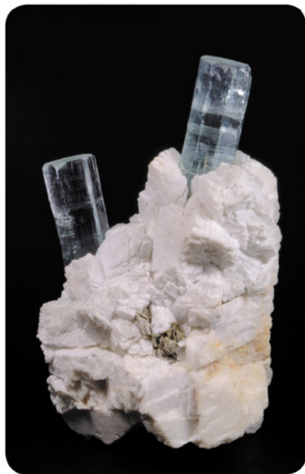
Аквамарин, полевой шпат (месторождение Скарду, Пакистан)

— Я ничего не утверждаю, потому что коллекционеры ориентируются в основном на другие категории: эстетичный вид (попросту — нравится или нет), сохранность образца (отсутствие сколов), прозрачность (у части минералов), яркость цвета, блеск на гранях. И