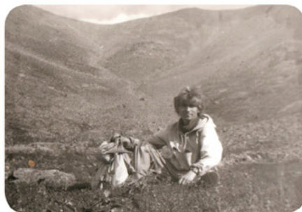
Хибины, 1993 год