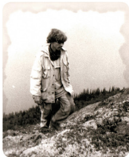
Ловозеро, 1993 год

— Родители присматривались. Против ничего не говорили, разве что в начале девяностых отец задавал мне риторические вопросы: «А что, сынок, твои камни тебя когда-нибудь кормить будут?» Естественно, я надеялся, что наступят такие времена. Но минералы — это долгая история, которая рассказывается достаточно медленно, терпение должно быть. А тогда, в девяностых, когда даже академики не знали, как дальше сложится их профессиональная карьера, уж